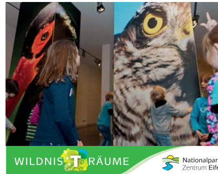
Die 2000 Quadratmeter große Erlebnisausstellung „Wildnis(t)räume“.

Erlebnisausstellung „Wildnis(t)räume“ im Nationalpark-Zentrum Eifel, Vogelsang 70, 53937 Schleiden-Vogelsang